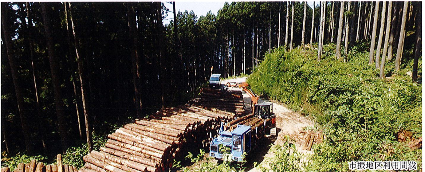
市振地区利用間伐

発行／ぬながわ森林組合 〒941-0052 新潟県糸魚川市南押上2-13-6 電話 025-552-1533