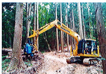
大道寺地区 伐倒作業