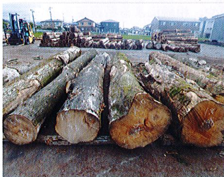
広葉樹も多数出材されました