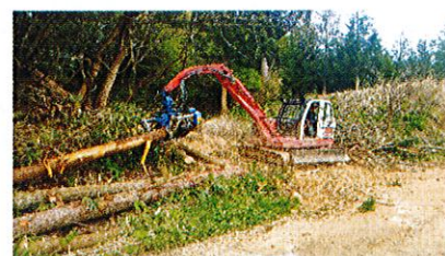
百川地区 造材作業