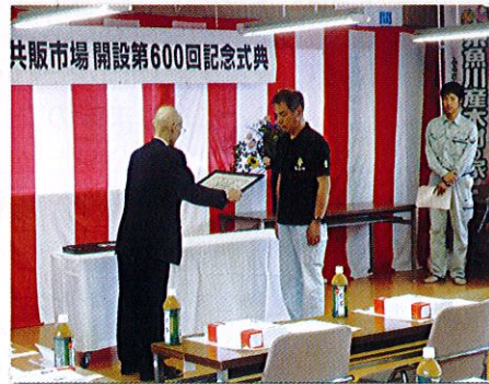
買方業者様へ感謝状贈呈