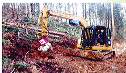
大和川地区 作業道開設